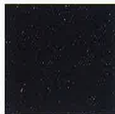
col.no/74 ネイビー col.no/BK ブラック