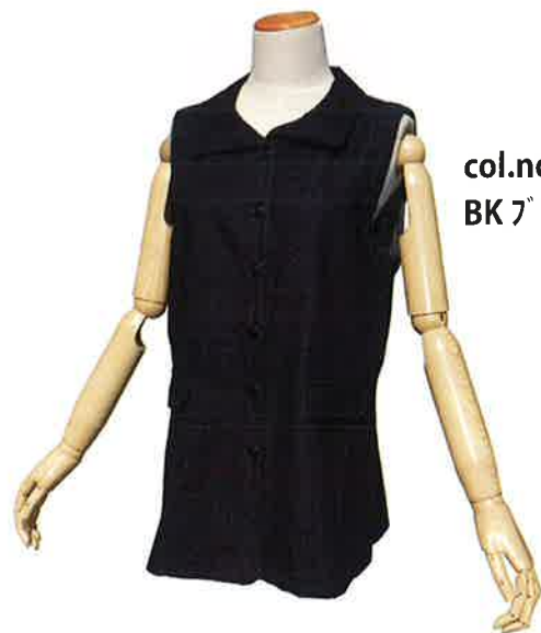
col.no/ BK ブラック