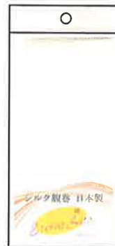
透明ヘッダー付 パッケージ入り