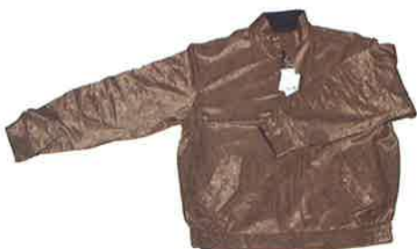
表 A (ペイズリー)